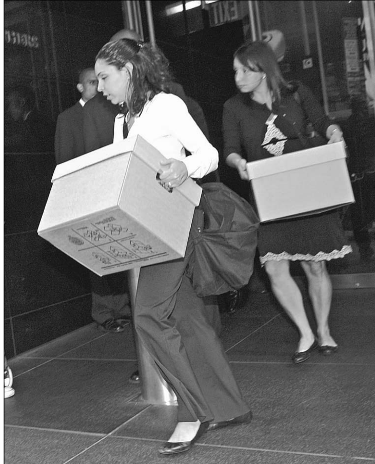
Personas despedidas de sus empleos por cierre de negocios durante la crisis económica no han visto otra solución que declararse en quiebra.

Las bancarrotas personales aumentaron notablemente a mediados de los 90, manteniendo esa trayectoria hasta 2005, cuando se registró un récord de dos millones de declaraciones de quiebra. Sin embargo, el alza se debe en buena parte a que muchos se apresuraron a presentar la declaración antes de que se aprobara la reforma de ese año, que endurecía las condiciones para que el procedi-