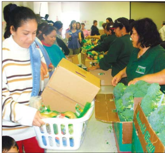
La distribución de comida en el Centro Comunitario de Mendota se ha convertido en algo más que frecuente, indispensable, para nutrir a miles de campesinos desempleados, víctimas del hambre.